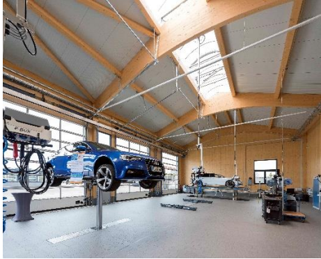
Autowerkstatt „Autohaus Harich“ in Balingen, Copyright: Willi Mayer Holzbau Bisingen

Schaffitzel Holzindustrie GmbH + Co. KG · Herdweg 23-24 · 74523 Schwäbisch Hall