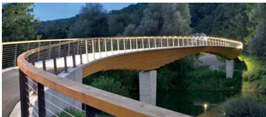
In die Handläufe aus Accoya-Brettschichtholz wurden LED-Leuchten eingearbeitet, die nachts den Weg weisen und ein weiteres optisches Detail darstellen.

Für das Bauwerk wurde bewusst der Werkstoff Holz ausgewählt. Das Einfügen in die naturnahe Umgebung stellte dabei eines der wichtigsten Kriterien dar. Doch gerade die anspruchsvolle Geometrie durch die zweifach gebogenen Brückenelemente legte den Werkstoff nahe.