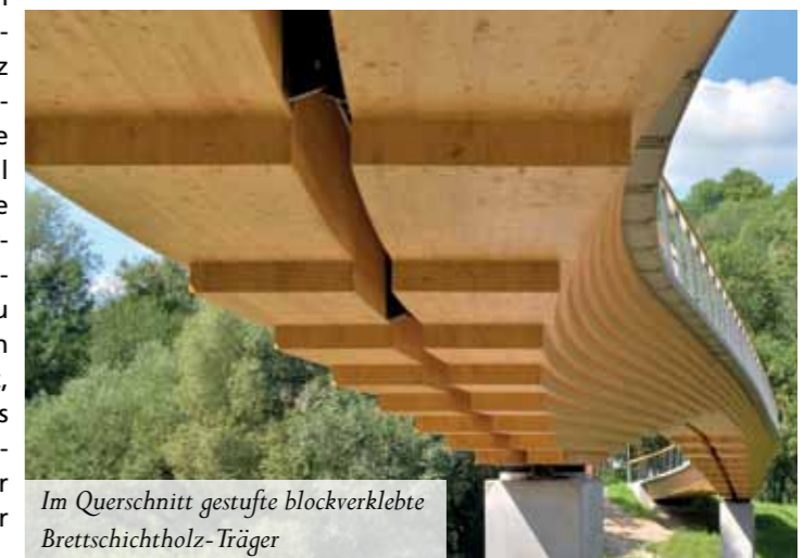
Im Querschnitt gestufte blockverklebte Brettschichtholz-Träger

„Ziel der Landesregierung ist es, die Position Baden-Württembergs als Holzbau-land Nummer Eins in Deutschland zu stärken“, so Minister Hauk. Die Neckartenzlinger Brücke bindet mit den verbauten 255 m 3 Fichten-Brettschichtholz rund 207 t CO 2 und ist damit eine innovative, moderne Brücke mit hohem ökologischen Wert, die sich mit eigener Ästhetik in die Umgebung einfügt.