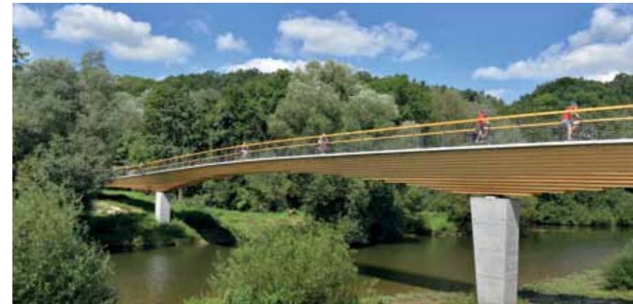
Die 96 m lange Fußgänger- und Radwegbrücke führt bei Neckartenzlingen über den Neckar und dient der Verbesserung des Neckartalradweges.