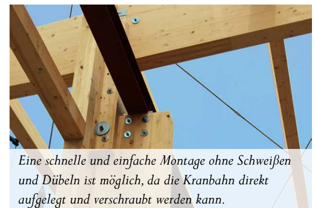
Eine schnelle und einfache Montage ohne Schweißen und Dübeln ist möglich, da die Kranbahn direkt aufgelegt und verschraubt werden kann.

den geliefert und kann sie dann selbst montieren ohne auf Subunternehmer zurückgreifen zu müssen. Zusammenfassend kann man sagen: Holzbau bietet nicht nur ökologische und ästhetische Vorteile, sondern auch