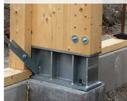
Es bieten sich im Wesentlichen fünf Varianten an, die Holzkonstruktion mit dem Fundament zu verbinden. Hier wurden Einspannstützen mit eingeschlitzten Stahlteilen und Stabdübeln verwendet.

Selbst Kranbahnstützen sind für die Firma Schaffitzel kein Problem. Weshalb Stahlbeton verwenden, wenn es mit Holz genauso und sogar besser geht? Viele Unternehmen trauen sich an solch innovative Projekte nicht heran, die Idee mit den Kranbahnstützen hat sich aber aus einem kontinuierlichen Verbesserungsprozess heraus ergeben. Der Erfolg spricht für sich, denn es wurden in kürzester Zeit mehrere Hallen mit dieser Stützenart gebaut. Für Holzbaufans passen Kranbahn- und generell eingespannte Stützen aus Holz nicht nur zur eigenen Philosophie, sondern sie können möglicherweise ihre eigene Wertschöpfung dadurch verbessern. Ein Zimmerer z.B. bekommt die Stützen von Schaffitzel fertig abge-