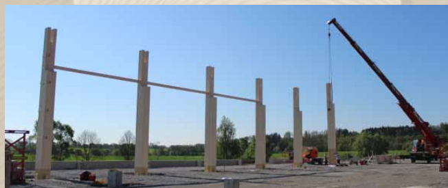
Kurz vor Redaktionsschluss sind die Kranbahnstützen der neuen Schaffitzel-Halle aufgestellt worden.

Ab Mitte September produzieren wir dann 6000-7000 lfm/Schicht, was einer Produktionsverdoppelung entspricht. Die neue Anlage kann bis zu 45 m Länge produzieren. Dies bedeutet, dass zwei Satteldachträger mit 22 m Länge hintereinander produziert werden können. Gerade Bauteile sind bis 38 m oder 20 m und 18 m hintereinander möglich. Im Herbst werden wir unter anderem ein Extra-Informationsblatt über die Maschinenanlage und den Neubau herausgeben. Freuen Sie sich darauf.