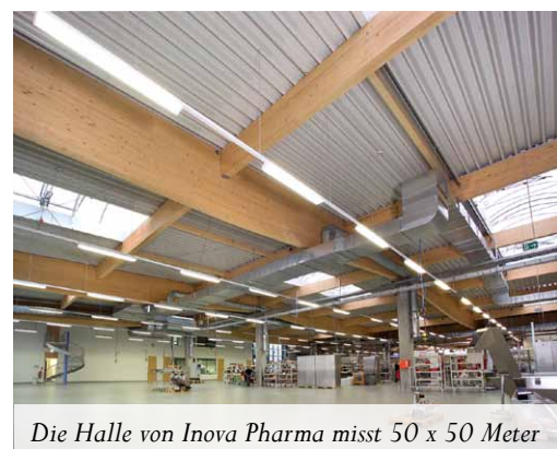
Die Halle von Inova Pharma misst 50 x 50 Meter

Laut der Ausschreibung für das 5000 m 2 große Kompetenzzentrum für Oberflächentechnologie der Firma Knauf Riessler sollte das Bauvorhaben ursprünglich komplett in Massivbauweise gebaut werden. Durch fundierte Argumentation von Holzbaufachleuten aber wurde das Architekturbüro Blum Diez davon überzeugt, die Konstruktion