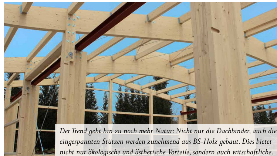
Der Trend geht hin zu noch mehr Natur: Nicht nur die Dachbinder, auch die eingespannten Stützen werden zunehmend aus BS-Holz gebaut. Dies bietet nicht nur ökologische und ästhetische Vorteile, sondern auch wirtschaftliche.

Den üblichen Beton- und Stahlstützen im Hallenbau erwächst ein starker Konkurrent: Eingespannte Stützen aus BS-Holz sind nicht nur ökologischer, sehen hervorragend aus und geben ein angenehmes Raumklima. Sie haben auch eine Fülle technischer Vorteile. So erleichtert ihr verhältnismäßig geringes Gewicht den Transport und die Montage. Die Gesamtkonstruktion des Tragwerks lässt sich schnell und durchgehend montieren, Wandbauteile lassen sich an das Holz problemlos anschließen. Weil insgesamt kleinere Fundamente benötigt werden, fallen