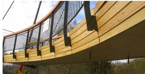
Montage der Brücke am Aggerbogen bei Lohmar

brücke, die sich S-förmig geschwungen ins Naturschutz- und Radwandergebiet