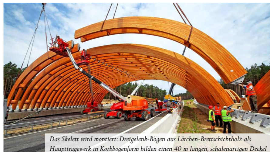
Das Skelett wird montiert: Dreigelenk-Bögen aus Lärchen-Brettschichtholz als Haupttragwerk in Korbbogenform bilden einen 40 m langen, schalenartigen Deckel

Die Bundesstraße B 101 ist neben den beiden Bundesautobahnen A 9 und A 13 die wichtigste Verbindung zwischen Berlin und Südbrandenburg. Seit August überspannt bei Luckenwalde eine Grünbrücke die Fahrbahn. Grünbrücken sind erdüberschüttete und bepflanzte Überführungsbauwerke, die für den gefährlosen Wildwechsel gedacht sind. Das Bundeskabinett hat Ende Februar 2012 ein Programm für 93 neue Que-