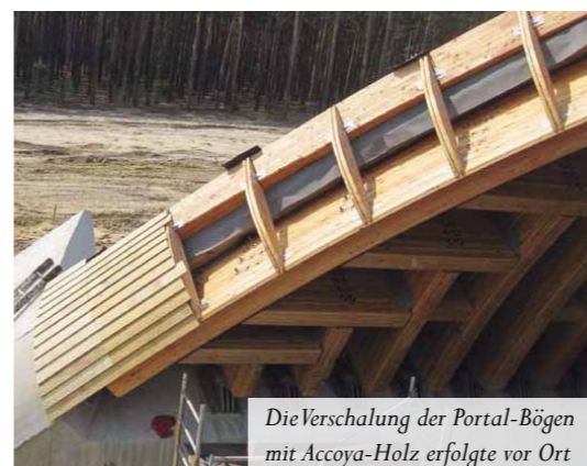
Die Verschalung der Portal-Bögen mit Accoya-Holz erfolgte vor Ort

errichten war. Die Montage der gesamten vorgefertigten Holzkonstruktion dauerte lediglich vier Tage. Eine Vollsperrung der B 101 war nur für sehr kurze Zeit erforderlich. Hervorzuheben sind auch zwei Kriterien: Brennt ein Fahrzeug unter der Brücke, wird Holz weniger geschädigt als Beton. Tragwerksteile lassen sich relativ einfach austauschen. Dasselbe gilt für mechanische Schäden am Tragwerk durch Unfälle. Zusätzliche Argumente für Holz waren die bessere Ökobilanz