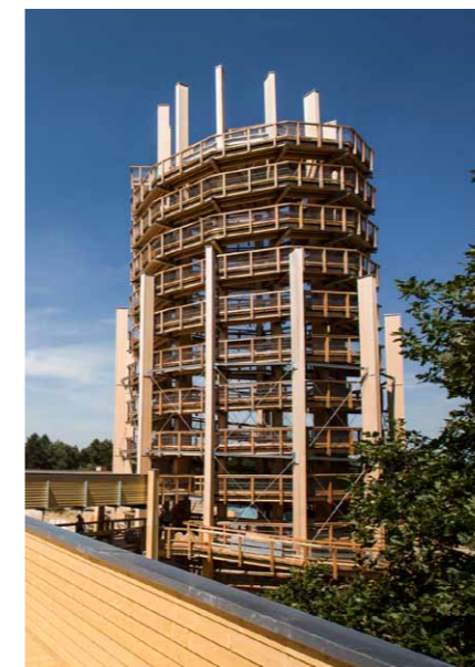
Der Aussichtsturm ist 40 m hoch und hat eine Plattform mit 12 m Durchmesser.

Dem Thema Langlebigkeit wurde von Beginn an ein hoher Stellenwert gegeben.