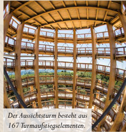
Der Aussichtsturm besteht aus 167 Turmaufstiegssegmenten.

Baumwipfelpfad zu verbinden. Damit sich entgegenkommende Besucher nicht gegenseitig behindern, sollte diese Verbindung zweistöckig sein, sodass man auf dem unteren Niveau in den Wald hineinläuft und über die obere Brücke wieder herausgelangt. Die konkrete Höhe des Turmes wurde 2008 mit einem Kran und angehängten Mannkorb ermittelt - schließlich sollte der Turm so hoch werden, dass man Sicht auf die Besonderheiten in der umgebenden Landschaft erhält. Der Turm besteht aus 2 ringförmig angeordneten Stützenkreisen mit jeweils 12 Stützen. Die inneren Stützen schieben bis über das Niveau der Aussichtsplattform heraus. Der äußere Stützenring endet bei ca. 2/3 der Höhe des