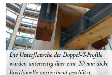
Die Unterflansche der Doppel-T-Profile wurden unterseitig über eine 20 mm dicke Brettlamelle ausreichend geschützt.

song auch möglich, eine Nutzung für 30 Minuten bei gleichzeitigem Ausfall einzelner maßgebender Bauteile infolge Brandbeanspruchung nachzuweisen. Hierfür wurden verschiedene Brandszenarien untersucht. Zum Beispiel wurden bei Brand eines Papierkorbs für die in diesem Bereich angeordneten Rundstahl-Diagonalver-