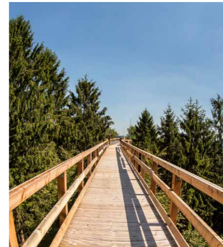
Durch das stark abfallende Gelände entsteht eine dramatisch gefühlte Höhenentwicklung von 4 m auf 24 m Höhe.

Bei dem Zugangsbauwerk handelt es sich um drei Brückenelemente in Trogbauweise. An diese Trogbauweisen, die eine Länge von jeweils ca. 20 m aufweisen, ist unterseitig jeweils noch eine Gehbahn in Holz-Stahlbauweise angehängt. So werden Besucher auf der unteren Ebene zum Rundweg hin-