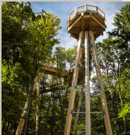
Aus 24 m Höhe hat man einen Ausblick auf die verschiedenen Baumvegetationszonen.

Die Planungen von Panarbora und dem Baumwipfelpfad begannen im Dezember 2007 - das Büro ahrens & eggemann war von Anfang an damit betraut. Auf einem stillgelegten Kasernengelände sollte die Vision von einem Naturerlebnispark der besonderen Art umgesetzt werden. Bei einer Begehung der umliegenden Wälder kristallisierte sich schnell ein besonderes Waldstück und geeigneter Bauplatz für den Baumwipfelpfad und Aussichtsturm heraus. Dieses war gekennzeichnet durch einen hohen Anteil an verschiedenen Baumarten wie Buchen, Eichen, Ilex, Birken und einigen Fichten. Zudem war das Ge-